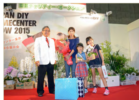
来場 600 万人達成