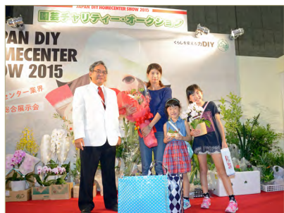
来場 600 万人達成

昨年の本ショウは、「暮らしに、ひと手間。つくる、すまいの未来！」をショウテーマに 469 社、1,046 小間（うち海外 10 カ国・地域、117 社、142 小間）の出展を頂き、幕張メッセ国際 展示場 4 ホールに 3 日間で 106,936 人と前回に引き続き 10 万人を超える来場者を記録しました。 また、会期中には累計 600 万人の来場も達成しました。常日頃から当協会活動に惜しみない 協力をしてくださる会員各社、本ショウに参加される企業・団体の皆様のお蔭と存じます。また、