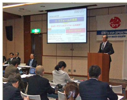
前回（2015年11月）の開催説明会の様子

また、第 2 回開催説明会を 2 月 19 日（金）、午後 2 時より東京・神田の T K P 神田駅前ビジネスセンターで開催することが決定されました。既に昨年 11 月より開始している出展促進活動については、出展案内パンフレットを協会会員社・昨年出展社をはじめ、国内の関連団体、政府機関に追って配布する予定です。