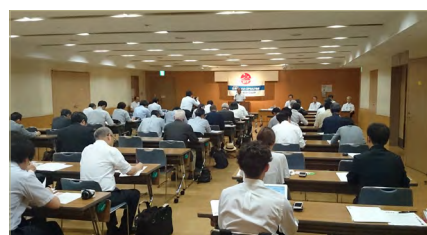
上：参展公司说明会下：记者发布会