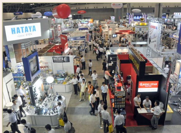
*写真は前回ショウの様子

JAPAN DIY HOMECENTER SHOW 2012のショウテーマは「夢を力に! - Make Your Dreams Your Power! -」です。48回目を迎える今回は、幅広い分野から出展社が参加し、来場者と満足のいくマッチングが図れるように出展品目を再編・拡充し、斬新な企画を揃えて、日本の生活を支える「底力」となるショウを目指します。