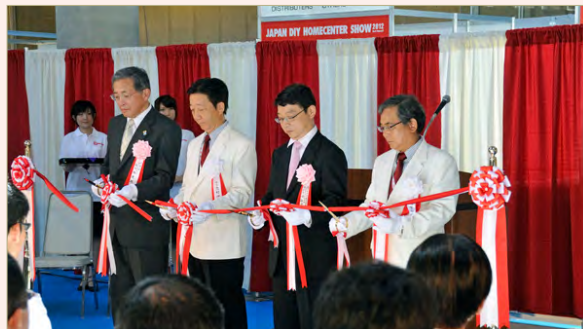
* 開会式・テープカット

JAPAN DIY HOMECENTER SHOW 2012 が、高円宮妃久子殿下を名誉総裁にお迎えし、8 月 23 日（木）－ 8 月 25 日（土）の 3 日間、千葉県幕張メッセで開催されました。