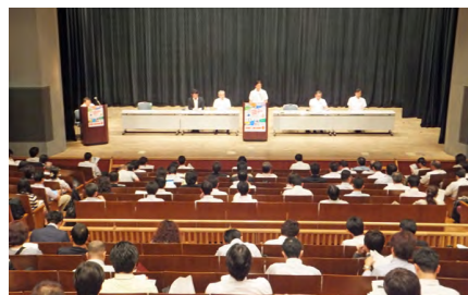
前回出展社説明会

7月9日(火)午後1時30分から、亀戸文化センター(東京都江東区亀戸2-19-1、JR亀戸駅徒歩2分)で開催します。詳細は、追って出展企業の方々へご案内いたします。出展資料は下記ウェブサイトにてダウンロードいただけます。