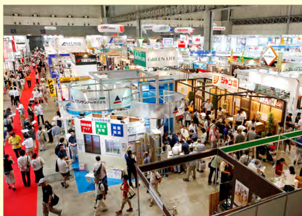
* 写真は前回ショウの様子

JAPAN DIY HOMECENTER SHOW 2013 のショウテーマは「あしたを Dreaming！ ～世界はたくさんの夢に満ちている～」です。49 回目を迎える今回は、女性による DIY を意識した新たな出展品目を加えて、幅広い分野の出展社と多岐にわたる来場者がマッチングを図れる魅力ある新しい提案を行います。